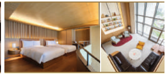
아난티 옛 부산 빌라주 오션뷰 복층 캐빈